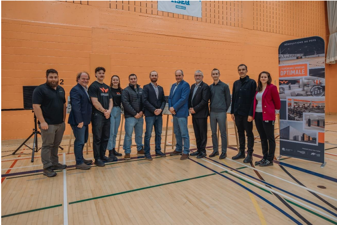
Sur la photo : Des représentantes et des représentants du Collège de Rimouski, des Pionnières et des Pionniers, du conseil d'administration du Collège de Rimouski, de la mairie de Rimouski, de l'entreprise TechniPro BSL et de la firme d'architectes Proulx et Savard.