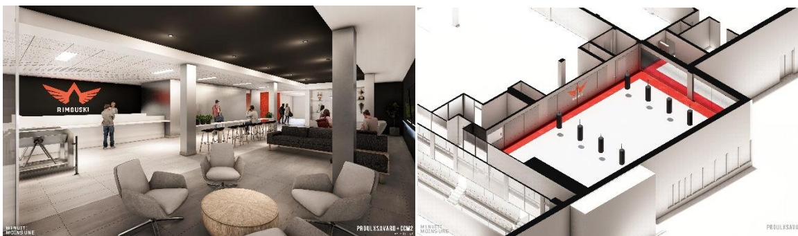
Sur les photos : un aperçu des futures installations du PEPS rénové

Le conseil d'administration du Collège a retenu les services de la firme Construction TechniPro BSL pour mener à bien les travaux dans le cadre financier prévu. Ils seront entamés dès février 2024 et s'échelonneront jusqu'à la rentrée d'automne 2025.